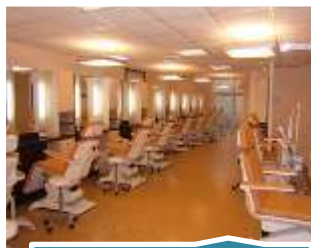
Soin du Corps