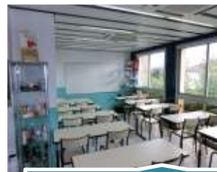
Salle de théorie